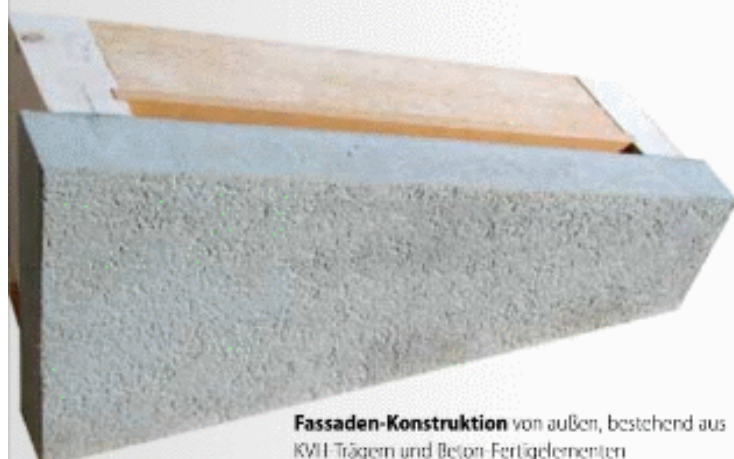
Fassaden-Konstruktion von außen, bestehend aus KVL-Trägern und Beton-Fertigelementen