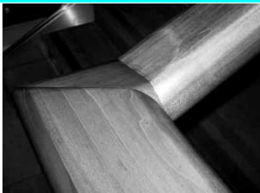
Lümmelbords von Kolar