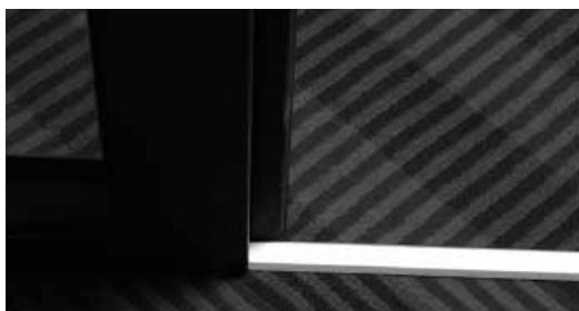
Flachprofile in fünf Breiten und vier Farben von Direct Handling