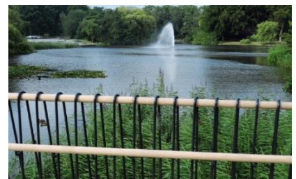
Handlauf für Brückengeländer